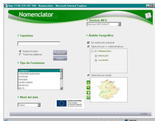
Fig.1: Nomenclátor de www.ideextremadura.es